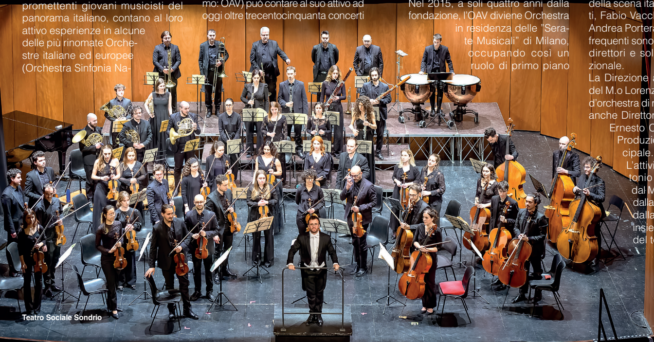
Teatro Sociale Sondrio

L'attività dell'Orchestra Antonio Vivaldi è sostenuta dal Ministero della Cultura, dalla Regione Lombardia e dalla Provincia di Sondrio insieme ad altri Enti Locali del territorio. (2025)